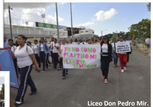
Liceo Don Pedro Mir.