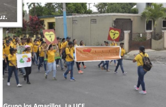
Grupo los Amarillos, La UCE.

Estudiantes exhiben sus manualidades recicladas como parte del aporte al medio ambiente.