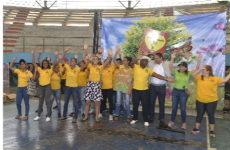
Socio Drama, Grupo los Amarillos, la UCE.