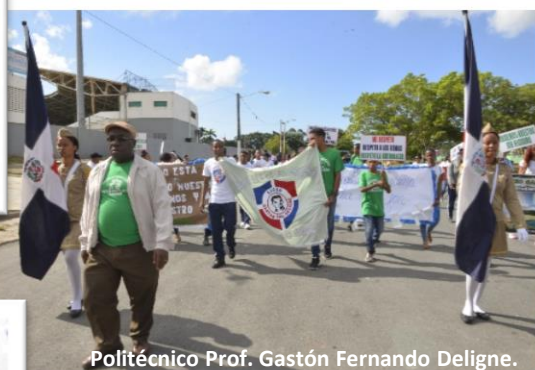
Politécnico Prof. Gastón Fernando Deligne.