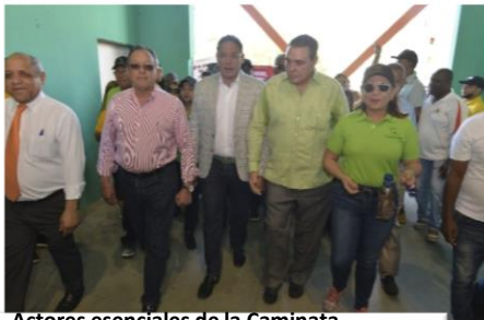
Actores esenciales de la Caminata.