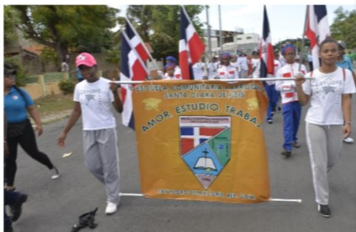
Escuela Comunitaria Parroquia Santo Cura de Asís.