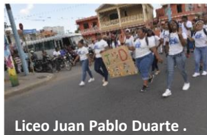
Liceo Juan Pablo Duarte.