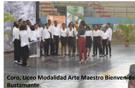
Coro, Liceo Modalidad Arte Maestro Bienvenido Bustamante.