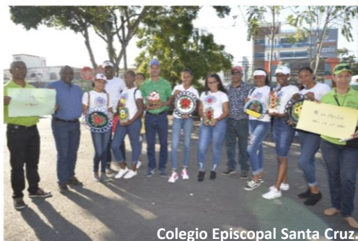
Colegio Episcopal Santa Cruz.

Estudiantes exhiben sus manualidades recicladas como parte del aporte al medio ambiente.