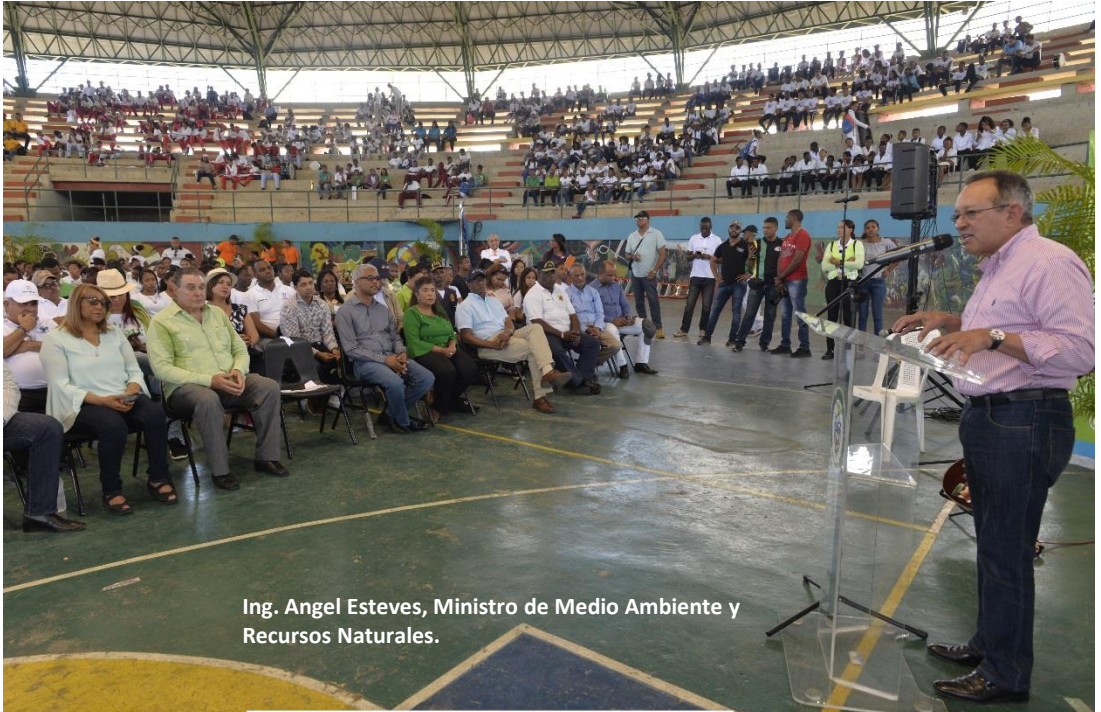
Ing. Angel Esteves, Ministro de Medio Ambiente y Recursos Naturales.