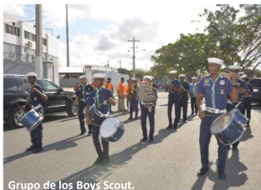
Grupo de los Boys Scout.

Con la participación 2000 ciudadanos entre ellos Estudiantes, Maestros, Directores de 13 centros educativos y el grupo los Amarillos de la UCE, de la provincia San Pedro de Macorís.