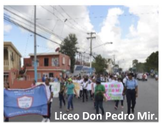
Liceo Don Pedro Mir.