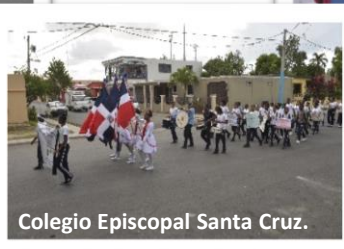
Colegio Episcopal Santa Cruz.