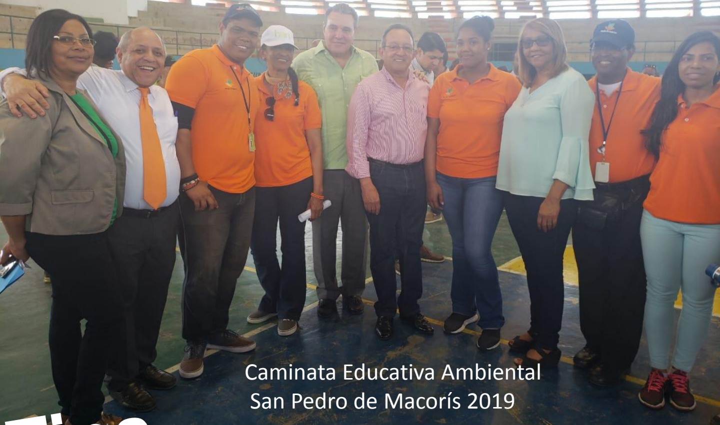
Caminata Educativa Ambiental San Pedro de Macorís 2019