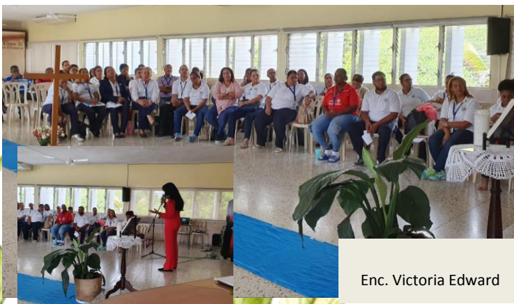
Enc. Victoria Edward

El programa Escuela Verde se hizo presente en el Colegio Quisqueya, capacitando a más de 40 docentes y miembros de la asociación de Padres y Amigos de la Escuela, sobre la "Importancia del Medio Ambiente y el programa Escuela Verde", a través de la Dirección de Educación y Divulgación Ambiental.