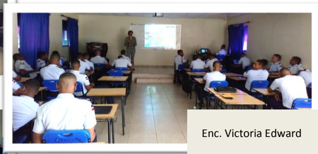
Enc. Victoria Edward

La Dirección de Educación y Divulgación, realizó un ciclo de 8 capacitaciones sobre Temas Ambientales. Esta actividad fue coordinada con la Academia Aérea de cadetes de la Fuerza Armada. Donde logramos capacitar a 46 alistados de la academia.