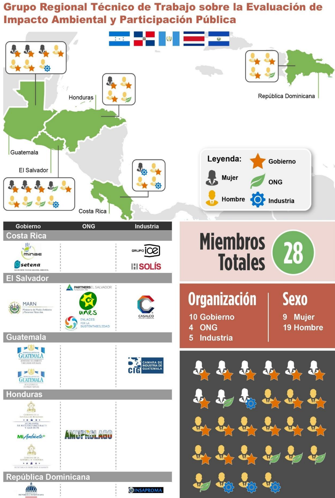
Figura 5: Grupo Regional Técnico de Trabajo sobre la Evaluación de Impacto Ambiental y Participación Pública