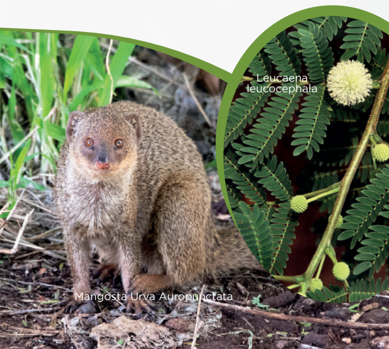
Mangosta Urva Auropunctata

Además, la resolución No. 006/2010 creó el Comité Nacional sobre Especies Exóticas Invasoras que asesora al Ministerio de Medio Ambiente y Recursos Naturales en todos los aspectos relacionados con la prevención, gestión, manejo y control de las especies exóticas invasoras.