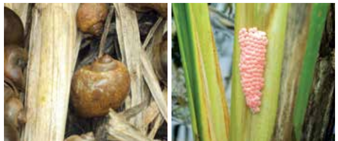
Conchas y huevos de Pomacea canaliculata o caracol del arroz especie invasora que afecta a estos cultivos

En el caso específico de República Dominicana, se encuentran varias especies de invertebrados que han llegado accidentalmente o por manejo negligente, tales como: mosquita blanca ( Bemisia tabaci ), trip ( Trips palmi ), caracol del arroz ( Pomacea canaliculata ) entre otras.