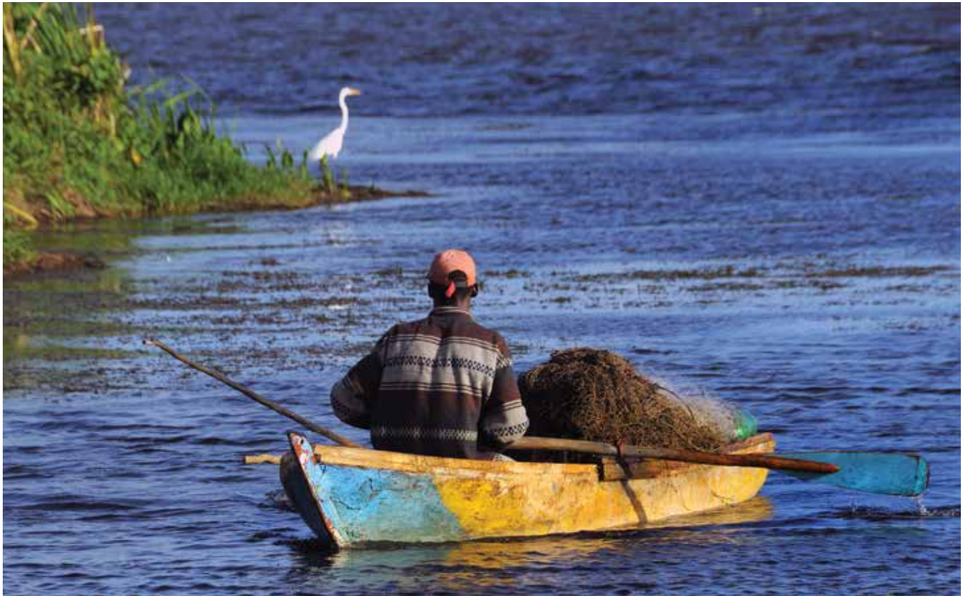
Hydrilla verticillata (limo), especie exótica invasora presente en laguna Limón, disminuye la disponibilidad de oxígeno afectando el desarrollo de peces y creando condiciones adversas para la navegación.