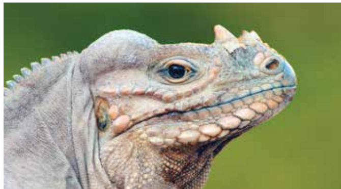
Las iguanas son especies amenazadas por la presencia de especies exóticas invasoras, como el caso de los gatos en isla Cabritos.

El conjunto de las especies nativas de una región forman la diversidad biológica . Esta diversidad biológica, mantenida dentro de su rango de distribución natural, puede competir con sus enemigos naturales; lo contrario ocurre cuando éstas son desplazadas y se forman extensas masas monoespecíficas, es decir, de una sola especie de la flora o una colonia de animales, que pueden ser afectados severamente por eventos naturales (plagas, enfermedades, ciclones, incendios).