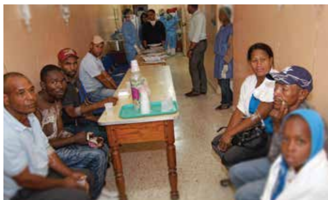
Personas afectadas por dengue

En Estados Unidos las pérdidas sociales generadas por las enfermedades exóticas anualmente está representada por la muerte de alrededor de 39,200 personas por SIDA, 540 por influenza y deben enfrentar unos 53,000 casos de sífilis.