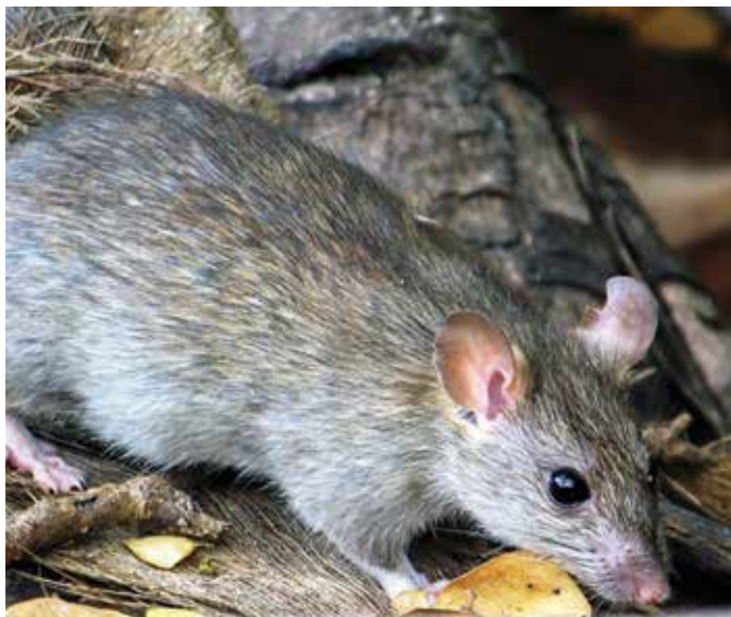
El ratón ( Rattus rattus ) transmite la leptospirosis.

En la agropecuaria las especies exóticas invasoras degradan las tierras y afectan la salud de los cultivos, exponiendo a los productores al incumplimiento de compromisos comerciales, haciéndolos vulnerables a sufrir embargos.