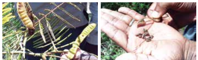
Mimosa pigra , una planta invasora detectada tempranamente en Uvero Alto, provincia La Altagracia. El foco fue erradicado.

Cuando las especies exóticas invasoras han sobrepasado las medidas de prevención e ingresan a un territorio, es necesario contar con mecanismos que permitan una respuesta inmediata, antes de que las mismas se establezcan y puedan dispersarse. La respuesta debe ser en red, rápida e integrada. Se deben mantener planes de contingencia y fondos para erradicar, contener o controlar las especies exóticas invasoras desde su entrada.