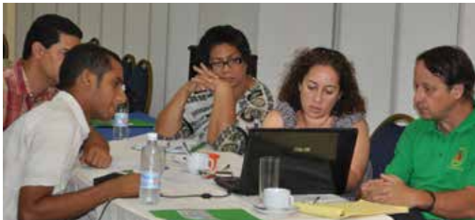
Integrantes del Comité Nacional de Especies Exóticas Invasoras en labores de planificación y elaboración de la Estrategia nacional de especies exóticas invasoras .

La prevención, manejo y erradicación de especies exóticas invasoras forma parte de los diversos convenios y programas internacionales para la protección del medio ambiente y la regulación del comercio internacional. La prevención es la medida más efectiva para enfrentar las especies invasoras, ya que la identificación de un invasor potencial, permitirá concentrar los recursos para impedir su entrada o dispersión, así como detectar y destruir las poblaciones iniciales poco después de su entrada.