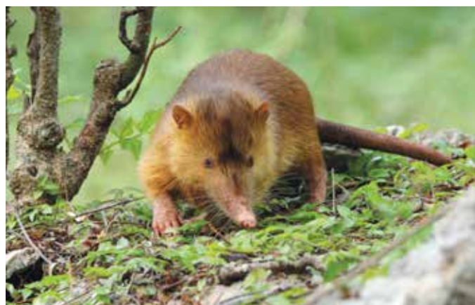
Entre los mamíferos terrestres sobresalen el solenodonte ( Solenodon paradoxus ) y la jutía ( Plagiodontia aedium ), ambos en peligro de extinción.