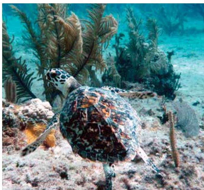
Carey ( Eretmochelys imbricata ) tortuga marina presente en La Hispaniola.

En La Hispaniola hay 6 mil especies de plantas aproximadamente. En el caso de los animales, los reptiles representan el mayor endemismo, siendo el de mayor envergadura el cocodrilo americano ( Crocodylus acutus ), propio del lago Enriquillo. Otra especie exclusiva es la iguana de Ricord ( Cyclura ricordi ). Otros reptiles de importancia presentes en la isla son: cuatro especies de tortugas marinas (carey, Eretmochelys imbricata ; tinglar, Dermochelys coriacea ; caguamo, Caretta caretta ; y tortuga verde, Chelonia mydas ), así como dos especies de agua dulce, conocidas como jicoteas.