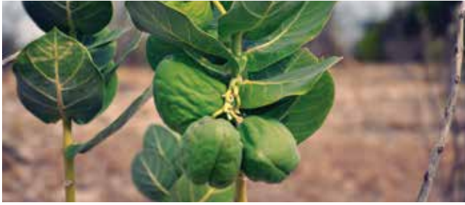
Calotropis procera , ha ocupado áreas en Alto Velo, isla Cabritos y otros lugares del Sur de la República Dominicana.

Asimismo, se han introducido especies de la flora, como árboles para mejorar el paisaje y dar sombra en las ciudades, que después se convierten en un verdadero problema, tal es el caso del almendro de la India ( Terminalia catapa ), la javilla extranjera ( Aleuritis fordii ), el chachá ( Albizia lebbek ), la amapola ( Spathodea campanulata ) y el caucho negro ( Castilla elastica ). Estas especies representan grandes riesgos para las infraestructuras urbanas y, en la vida silvestre, desplazan la vegetación nativa.