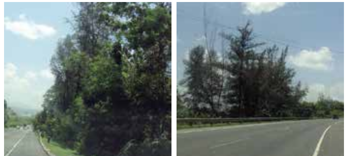
Casuarina equisetifolia , especie introducida para la recuperación de terrenos minados y como ornamental, afecta la vegetación naturales en playas y valles de carreteras.

Las introducciones voluntarias, especialmente en el caso de plantas, obedecen a diferentes propósitos (árboles frutales, ornamentales, reforestación para prevención de erosión, paisajes y, producción de madera y combustibles). En las actividades agrícolas se han introducido especies, principalmente invertebrados, con el propósito del control biológico de otras plagas.