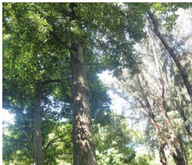
Mara ( Calophyllum calaba ), especie nativa de los bosques húmedos de Centroamérica y República Dominicana.

A modo de ejemplo de cuáles especies son las que se deben promover para garantizar la permanencia de las especies nativas y endémicas de la República Dominicana.