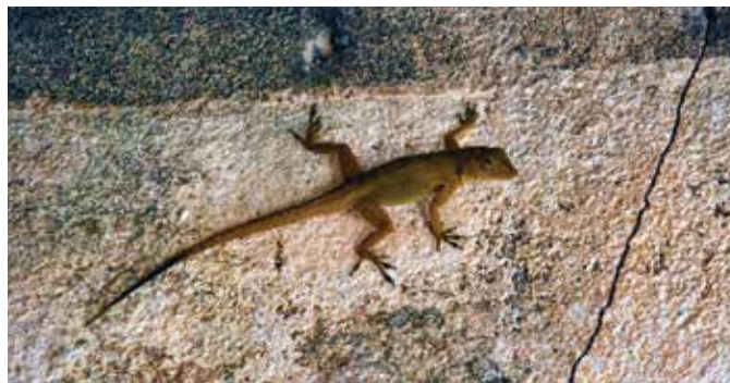
Anolis altavelensis , especie endémica, amenazada por la presencia de gatos y ratones en Alto Velo.

Las especies endémicas son aquellas exclusivas de un lugar y no ocurren de forma natural en ninguna otra parte del mundo. Cuando se dice que una especie es endémica se quiere decir que es única y exclusiva de un lugar.