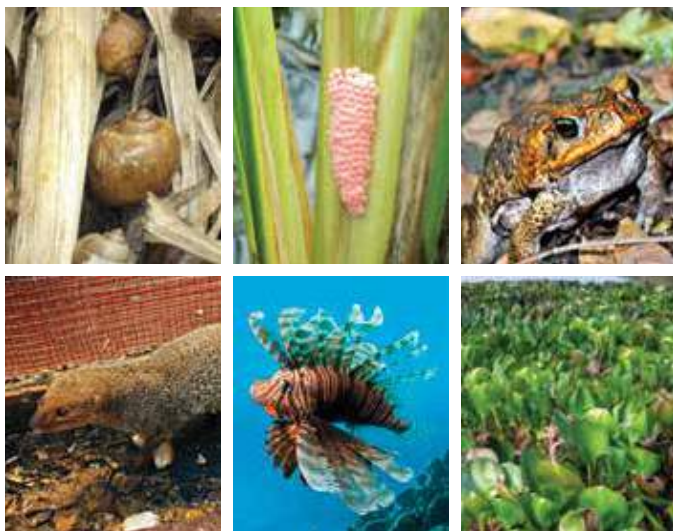
Especies exóticas invasoras en la Hispaniola: caracol del arroz, maco pen pen, jurón, pez león y lila.

Estos organismos, establecidos fuera de su área de distribución natural, son capaces de sobrevivir, reproducirse o distribuirse con gran agresividad, amenazando a la diversidad biológica en esos lugares, ya que no tienen competidores naturales.