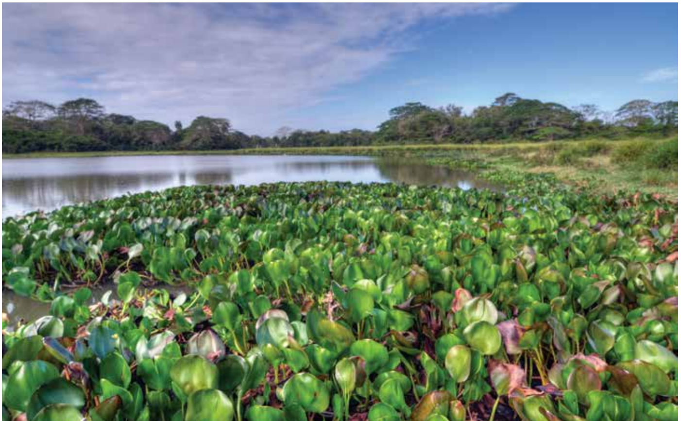
Lila ( Eichornia crassipes ) se ha convertido en un obstáculo para la navegación en el río Ozama.