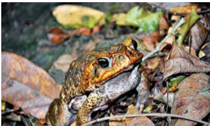
Maco pen pen ( Rhinella marina ) especie introducida para controlar insectos en plantaciones de Caña, afecta la población de abejas.

Los animales introducidos con fines de control biológico también han representado un grave problema para La Hispaniola. El hurón ( Herpestes javanicus ), introducido para controlar los ratones, se convirtió en un problema para la crianza de aves domésticas. El sapo grande o maco pen pen ( Rhinella marina ), fue introducido para controlar los insectos en las plantaciones de caña de azúcar y ha venido a ser un problema para los insectos nativos polinizadores y para las abejas.