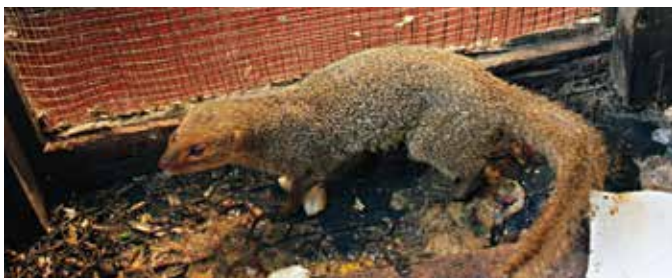
Hurón ( Herpestes javanicus ), introducido como control a los ratones, amenaza las aves de corral y sus huevos.

La introducción de especies invasoras en la región se relaciona íntimamente con las actividades productivas. El 66% de 191 especies vegetales están relacionadas a la horticultura. Del total de especies, la relación es como sigue: agricultura (23%), mascotas y acuarios (14,6%), acuicultura (21%), controles biológicos (11%) y transbordo accidental en el comercio (10%).