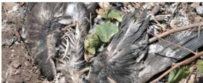
Pichones de bubies depredados por gatos en Alto Velo.

Muchos organismos de otros países o regiones sobreviven en ambientes nuevos sin mostrar efectos perjudiciales durante mucho tiempo; otros superan barreras ambientales, llegan a reproducirse y a establecerse fuera de su área de distribución natural. Afortunadamente, sólo el 10 por ciento de las especies introducidas se establecen exitosamente y de éstas, sólo el 10 por ciento se convierte en invasoras. Cuando los daños ocasionados por las especies invasoras son perceptibles generalmente ya han alcanzado grandes magnitudes de consecuencias irreversibles.