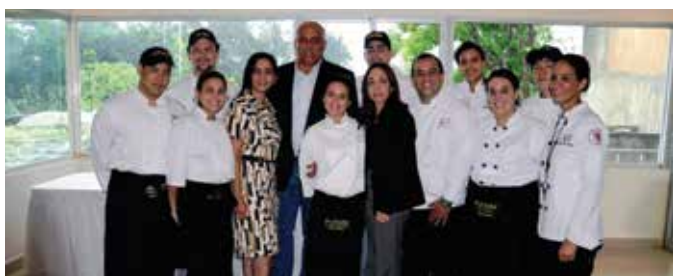
En República Dominicana se ha promovido el uso como alimento del pez león y el pez gato, como medidas de control. En la foto, actividad de degustación de platos a base de pez león en la PUCMM.

El control implica mantener a la población problema con baja abundancia, a través de un esfuerzo constante y sostenido a largo plazo. Para tener éxito en el control o erradicación de plagas es necesario conocer la biología del animal a controlar o erradicar. Es importante conocer su comportamiento social y su hábito alimentario.