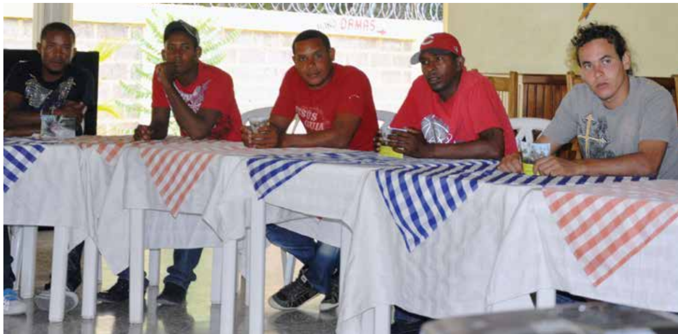
Taller de sensibilización y capacitación comunitaria, sobre biodiversidad y especies invasoras en Pedernales, 7 y 8 abril 2011.

Informar, sensibilizar y capacitar al público en general sobre las amenazas y riesgos que representan las especies exóticas invasoras para los ecosistemas, la biodiversidad, la economía y la salud humana.