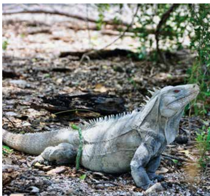
Cyclura ricordi , especie de iguana de La Hispaniola.