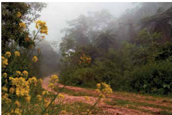
Bosque nublado, está formado por una gran variedad de especies de la flora y alberga diversas especies de la fauna.

Todos los seres vivos están relacionados entre sí y con el sitio en que se desarrollan, es decir, su hábitat; si se altera o modifica cualquiera de estos elementos, se afecta la biodiversidad en general, pudiendo producir incluso la desaparición de algunas especies.