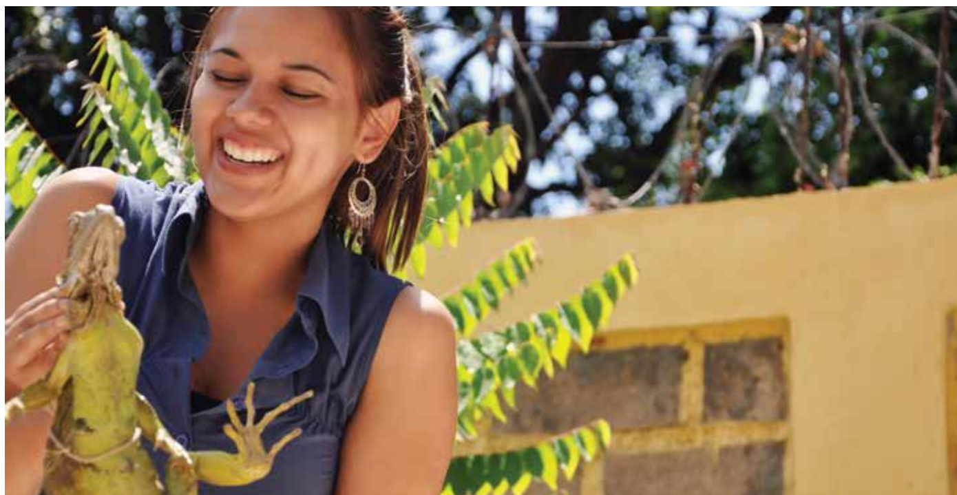
Iguana iguana , especie invasora, confiscada por la Dirección Provincial de Medio Ambiente de Perdenales, abril 2011.

Este cuadernillo forma parte del material que se ha elaborado para la concienciación sobre especies invasoras y biodiversidad, tanto para los estudiantes de Educación Básica, como para el público en general y en el mismo se entregan informaciones generales sobre los temas tratados.