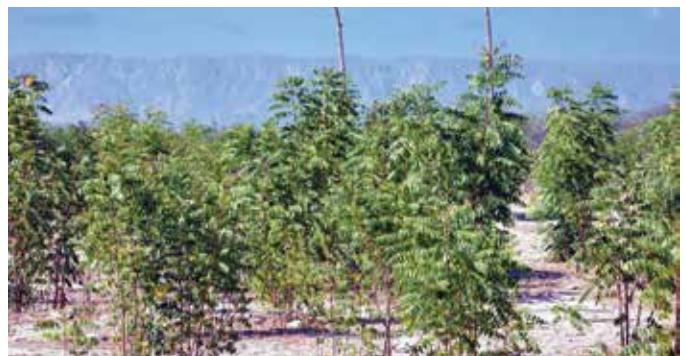
Nim invadiendo parcela en Neyba, donde destruye las infraestructuras de riego.

En la República Dominicana se observan daños por la germinación de nim ( Azadirachta indica ) en las aceras de las ciudades y en infraestructuras de regadío en las áreas rurales.