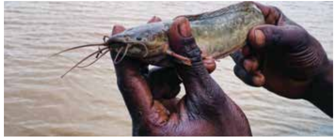
Pez gato ( Clarias batrachus ), especie exótica invasora presente en los cursos de agua dulce de la República Dominicana.

Debe destacarse además el caso del pez gato ( Clarias batrachus ), el cual fue introducido con fines de acuicultura privada y debido a un accidente natural fue introducido a la vida silvestre, representando un grave problema para la biodiversidad de los cursos de agua dulce de la República Dominicana.