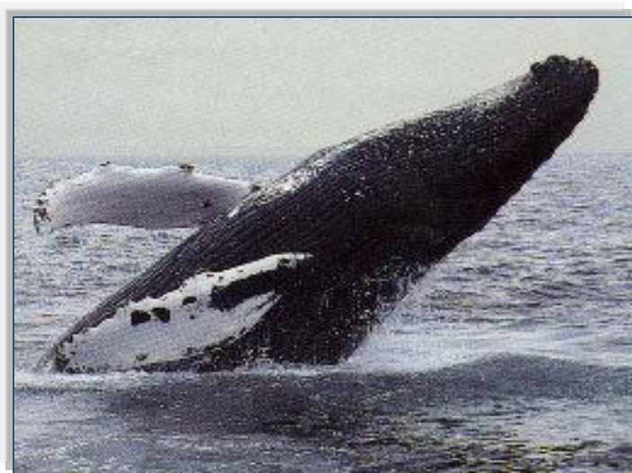
Santuario de Mamíferos Marinos – sector Samaná

Para que un país y sus autoridades tomen la decisión de designar un ámbito territorial como un espacio protegido, es necesario que el mismo disponga de ciertas singularidades, valores únicos y relevantes, de carácter natural o cultural, en capacidad de reeditar beneficios o servicios ambientales a favor de la colectividad social a nivel local, regional, nacional o internacional.