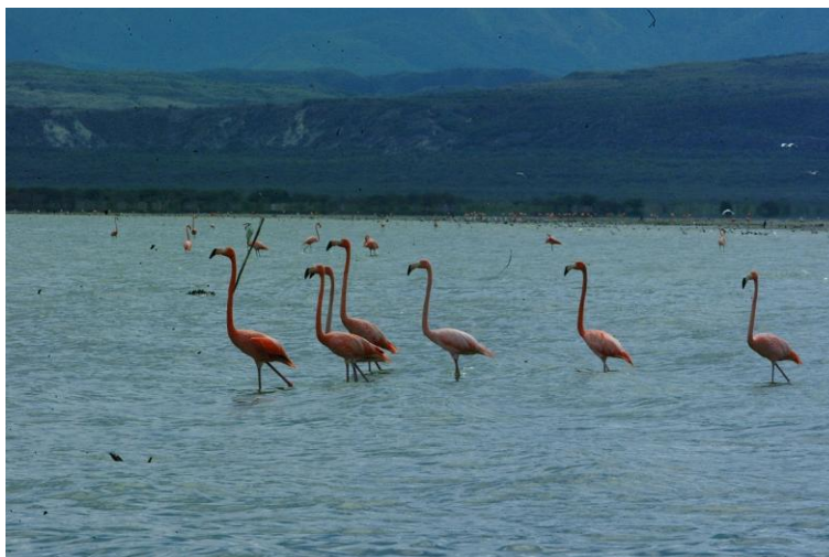
Parque Nacional Lago Enriquillo

La presión ejercida por el desorbitante desarrollo, sobre los recursos naturales, comenzó a generar preocupación y un interés de sectores de la sociedad por frenar de alguna manera las degradaciones y afectaciones a los recursos naturales, fue en ese contexto que surgió la primera chispa de apartar áreas naturales con fines de conservación, protección y preservación.