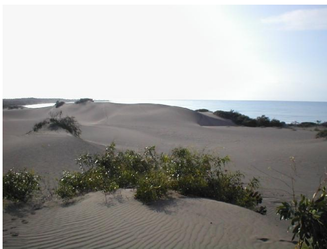
Monumento Natural Dunas de las Calderas

Pasado el tiempo, ese panorama de respeto y uso racional de los recursos naturales, desarrollado por las culturas ya citadas, inició un cambio en el que comenzaron a primar usos irracionales y grandes presiones de aprovechamiento, básicamente fundamentadas en las siguientes razones: