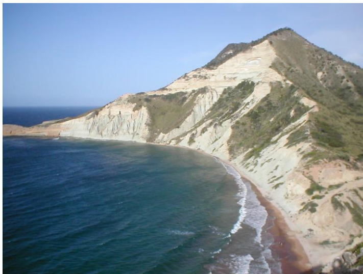
Parque Nacional El Morro, Monte Cristi

Los siguientes conceptos son importantes para una mejor comprensión de las áreas protegidas.