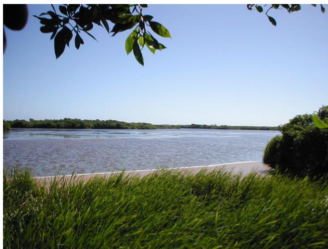
Refugio de Vida Silvestre Laguna Bávaro

El concepto parque nacional, quiere dejar notar que se trata de un área con valores naturales excepcionales de importancia nacional , y además que éstos (valores naturales) son propiedad de la nación, vale decir del pueblo .