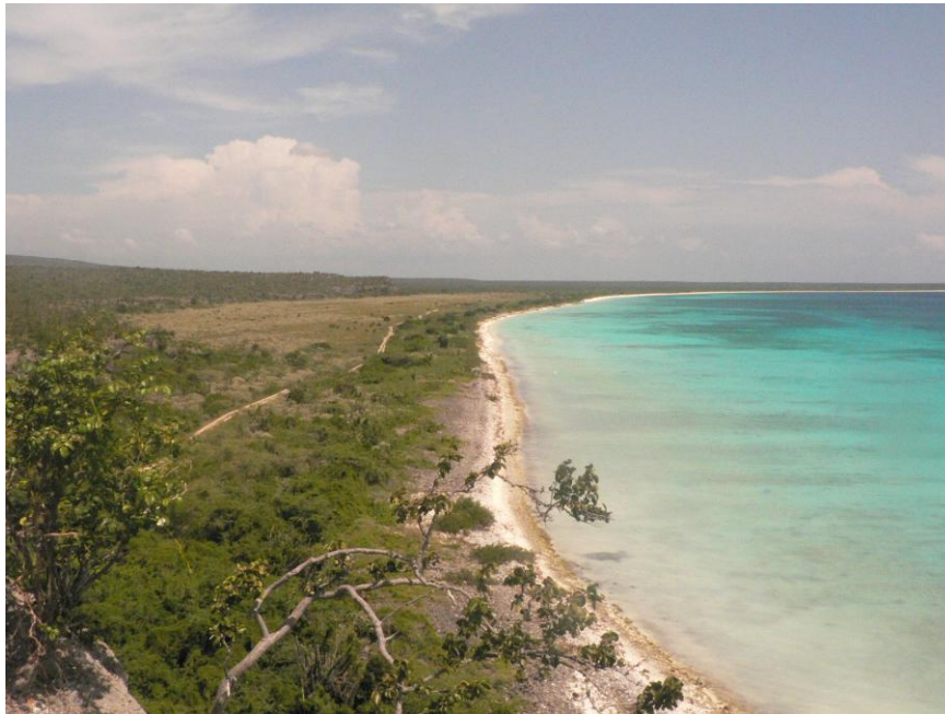
Parque Nacional Jaragua – sector Bahía de las Águilas