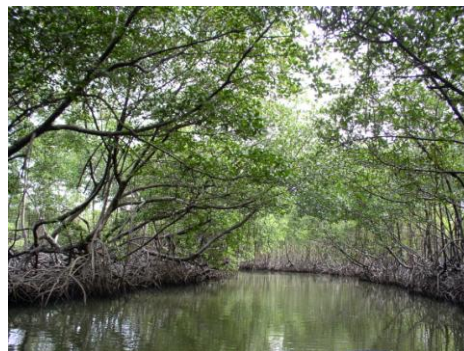
Parque Nacional Los Haitises

Como hemos visto, a lo largo de estas notas, los recursos naturales son básicos para el desenvolvimiento humano, cosa que al parecer olvidamos, y por ello, con frecuencia solemos afectarla. Las áreas protegidas constituyen un mecanismo técnico y de planificación de salvaguardar muestras representativas de las diversas regiones biogeográficas de la nación, para que éstas nos proporcionen servicios ambientales, sin los cuales no es posible la vida .