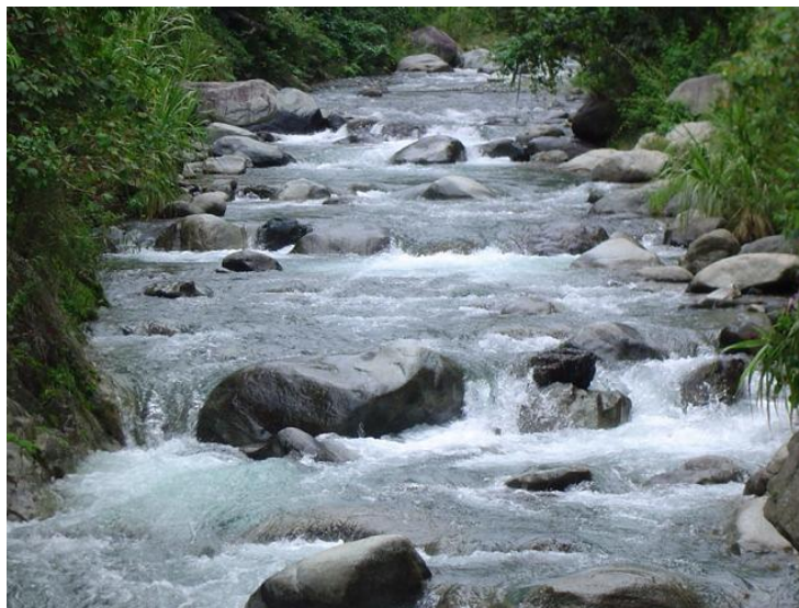
Parque Nacional Armando Bermúdez – Boca de los Ríos

Los beneficios que proporcionan las áreas protegidas están muy relacionados con la descripción que hemos hecho de sus objetivos, no obstante, hay ciertos renglones que conviene destacar por su relevancia e incidencia en el ser humano.