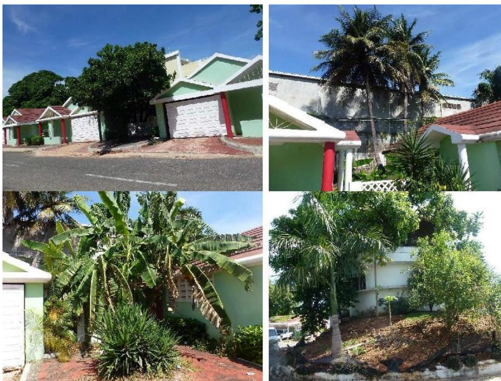
Foto 3.1. Mosaico de parte de la vegetación donde se construirá el proyecto