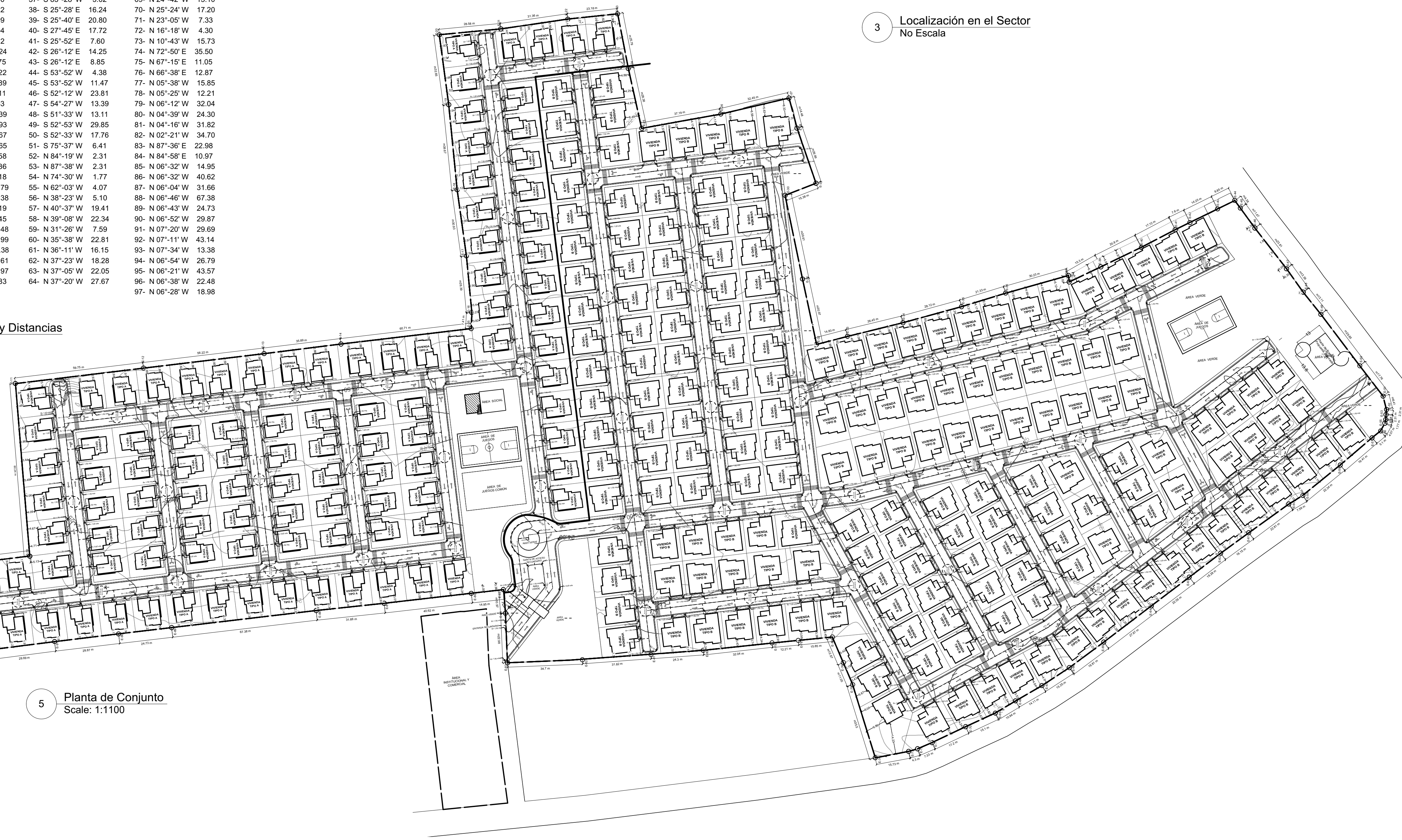
5 Planta de Conjunto Scale: 1:1100