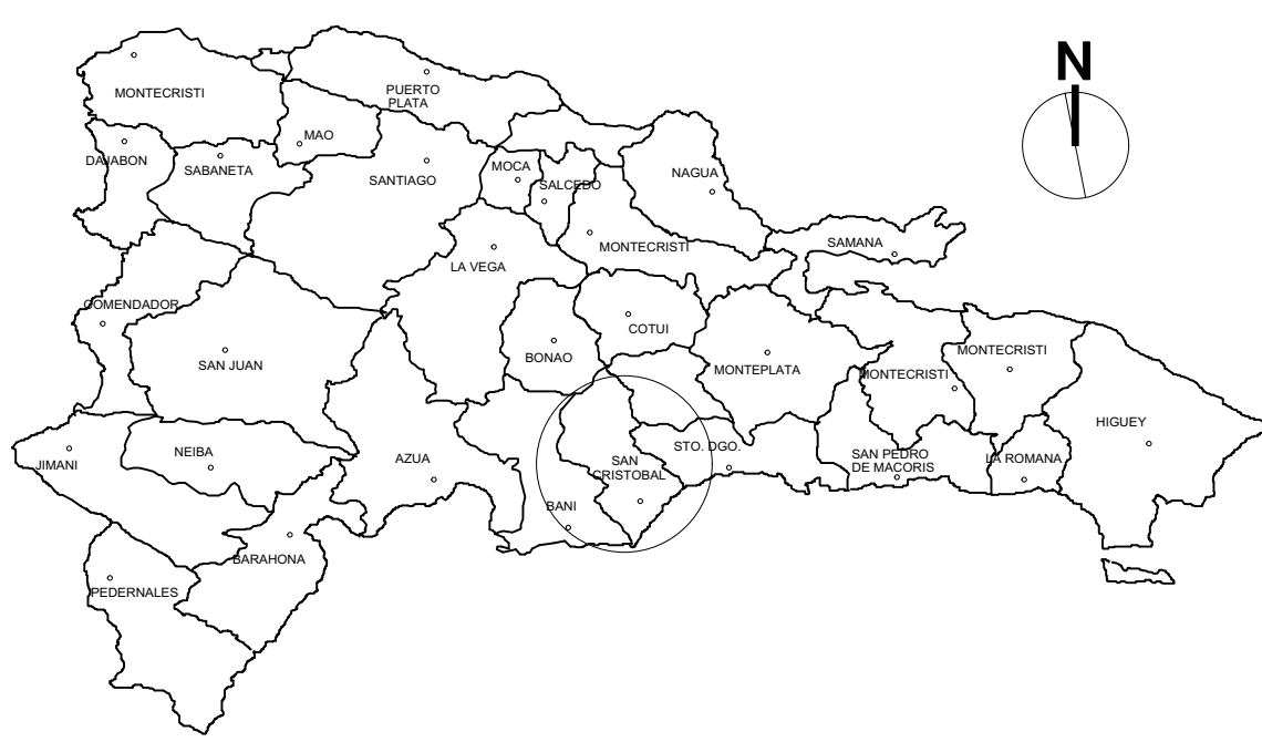
1 Localización en el país