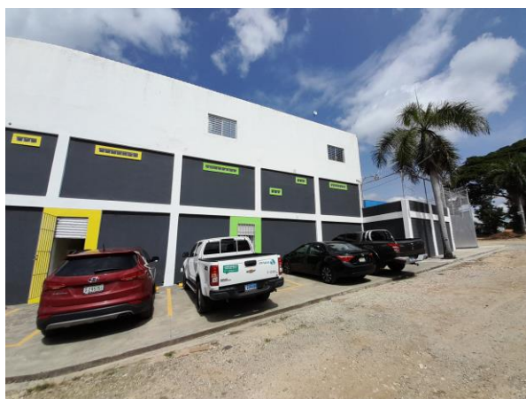
Foto 1. Instalaciones de Concentrados Flavors, S.R.L. (tomada el 10 de junio de 2022).

Las instalaciones Concentrados Flavors, S.R.L. consisten en una nave de tres niveles donde se encuentran depósitos y áreas de recepción de materias primas, áreas de producción, almacenes de materia prima, laboratorio de calidad, oficinas administrativas, cuarto de tratamiento primario de aguas, taller de mantenimiento, cocina y comedor de empleados.