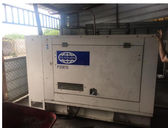
Foto 2. Generador eléctrico.