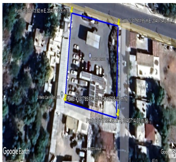
Figura 1. Ubicación del proyecto.

La Estación de Servicios Texaco Entrada de Azua, es un proyecto de venta y distribución de combustibles entre ellos Gasolina (Premium y regular), Gasoil (Premium y regular) para suplir las necesidades de los usuarios de las zonas aledañas, así como el tránsito de la carretera que comunica con Azua y Bani.