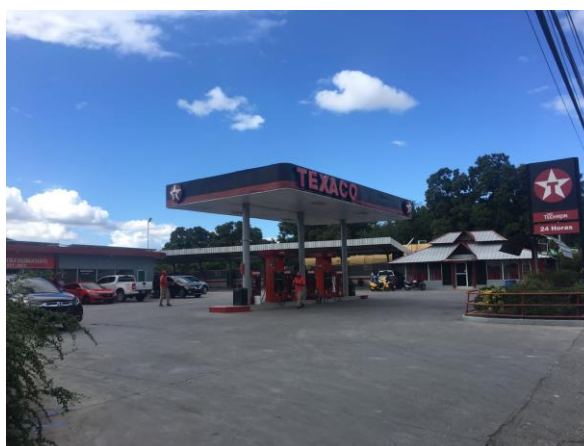
Foto 1- Vista frontal de la Estación.

El área del terreno donde funciona la instalación tiene una extensión superficial de 3,485.74 m 2 . La estación cuenta con 1 islas de despacho y dispone de 2 dispensadores con 4 mangueras en total, los cuales se alimentan de los diferentes tanques de almacenamiento de combustible.