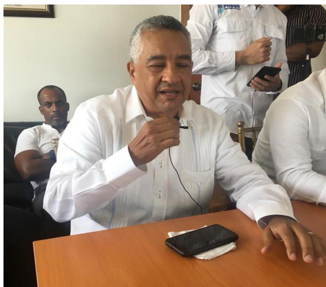
Figura 3-17. Lincoln Hernández Elipse S.R.L

que las comunidades aledañas y nuestros vecinos se benefician de eso, la economía que se desparraman es cuando los proyectos no tienen un objetivo común, del bienestar, no solamente de vender e ir a su casa y depositarlo en el banco, nosotros venimos de una familia de valores, que hacemos las actividades con un criterio de pulcritud, de paz y armonía y así será.