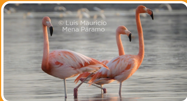
Flamenco americano Phoenicopterus ruber