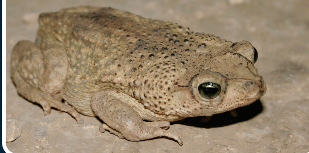
El sapo crestado sureño Peltophryni guentheri

En cuanto a los anfibios, se destacan: el sapo crestado sureño ( Peltophryni guentheri ), la hyla dominicana ( Osteopilus dominicensis ) y la rana calcalí ( Eleutherodactylus abbottii ) y demás especies endémicas de La Española. De los reptiles, su figura ejemplar es el cocodrilo americano ( Crocodylus acutus ) y las dos especies de iguana, iguana rinoceronte ( Cyclura cornuta ) y la iguana de Ricord ( Cyclura ricordii ).