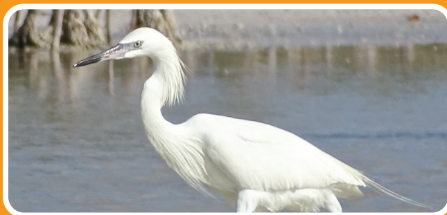
Garza rojiza Egretta rufescens

Las visitas a la Isla Cabritos para la observación de aves migratorias y el cocodrilo americano son un gran atractivo ecoturístico. Además, un sitio histórico con gran riqueza antropológica son “Las Caritas” en donde se encuentran numerosos petroglifos, hechos por los aborígenes preagrícolas, primeros pobladores de la isla que vivieron en la zona. Anímate a explorar la gran cantidad de petroglifos a través de las paredes, caras que sugieren la presencia de taínos hace miles de años.