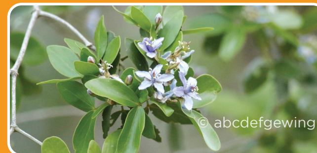
Guayacancillo Guaicum sanctum

En cuanto a la flora de la zona del lago Enriquillo y la isla Cabritos, un significativo porcentaje de las especies de flora reportadas son endémicas de la isla y hay varias especies de plantas amenazadas que son de interés para la conservación: melón espinoso, ( Melocactus lemairei ); guayacancillo, ( Guaicum sanctum ); cacheo, ( Pseudophoenix vinifera ), cana, ( Sabal domingensis ), y palma real, ( Roystonea hispaniolana ), mangle botón ( Conocarpus erectus ) y enneas ( Typha domingensis ) (MIMARENA, 2013).