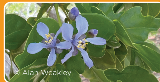
Guayacán Guaicum officinale