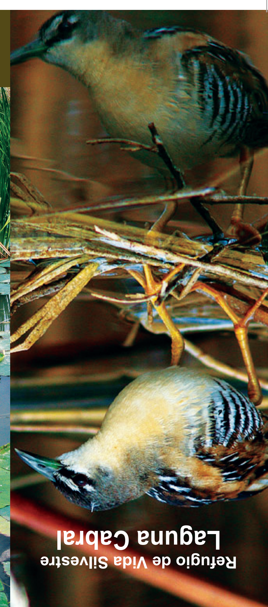
Laguna Cabral Refugio de Vida Silvestre

La Sierra de Bahoruco, cuya ladera norte conecta con este humedal, se formó en el terciario, hace más de 6 millones de años, y al Cerro Cristóbal y la Loma de Sal y Yeso al suroeste de la laguna se formaron en los últimos cinco millones de años debido al movimiento tectónico de las dos islas que dieron origen a esta región, ya que únicamente existían las llamadas paleo islas del norte y del sur, que al quedar conectadas formaron estas depresiones (la de la laguna) como la del Lago Enriquillo.