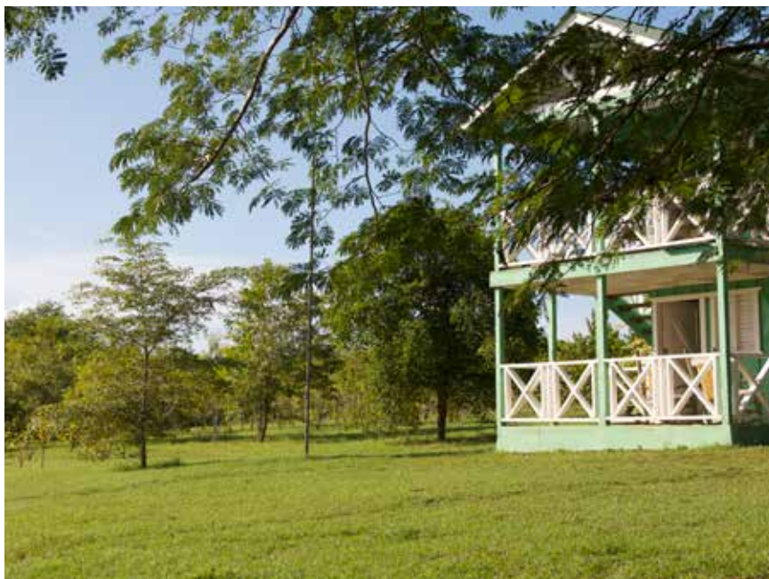
Centro de protección y vigilancia en laguna El Toro