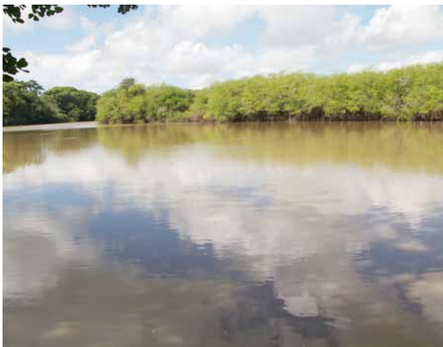
Laguna San José en buen estado de recuperación ecológica