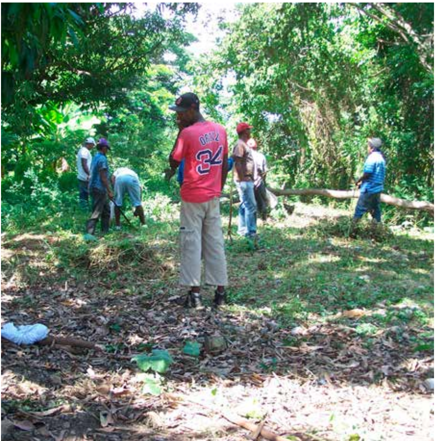
Área antes de iniciar el proceso de restauración ecológica en laguna Don Gregorio, Nizao, Provincia Peravia.

Con la finalidad de contribuir a la recuperación de los ecosistemas de Drago, la Dirección de Biodiversidad, con el apoyo del Proyecto Biodiversidad y Turismo, está implementando acciones de restauración ecológica a pequeña escala. Para ello se apoya en organizaciones locales que recolectan semillas, para lo cual fueron entrenados por técnicos especialistas y que luego son germinadas en el Banco de Semillas del Ministerio de Medio Ambiente y en algunos viveros locales; las plántulas ya están siendo utilizadas en la repoblación de lugares críticos.