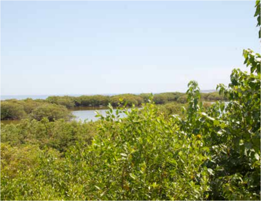
Resultados de la restauración ecológica en laguna Nigua