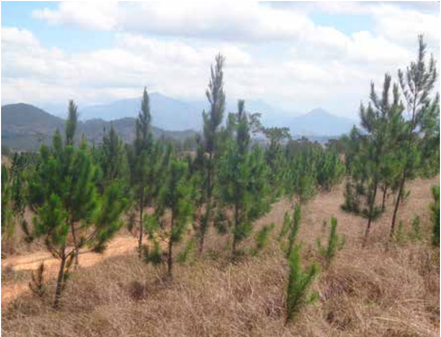
Área en proceso de restauración ecológica en la cuenca del río Libón

Diversas instituciones, programas y proyectos han asumido este modelo de Restauración Ecológica del Ministerio de Medio Ambiente; entre ellas, el Programa de Desarrollo Agroforestal que dirige la Presidencia de la República, con el concurso del Viceministerio de Recursos Forestales y que se implementa en seis áreas en la sierra de Neiba y la Cordillera Central; el proyecto de restauración ecológica de la cuenca del río Libón, en la zona fronteriza del municipio de Restauración, llevado a cabo con fondos del gobierno Alemán y gestionado por la GIZ. Otros proyectos más recientes son el de la cuenca del río Mulito, Pedernales, en la sierra de Bahoruco y el de la cuenca del río Ocoa.