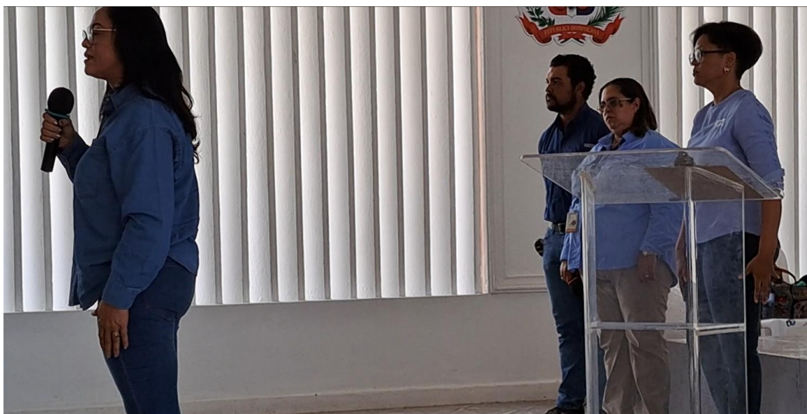
Figura 4-6. Se muestra a la Gobernadora dirigiéndose a los comunitarios durante la Vista Publica