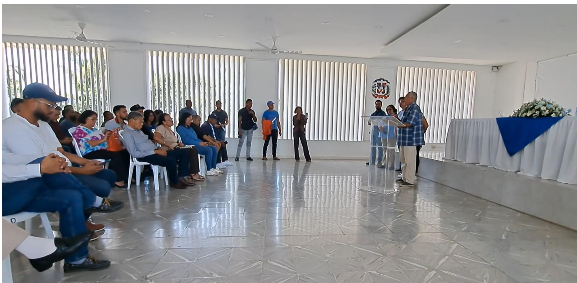
Figura 4-7. Momento de preguntas y respuestas