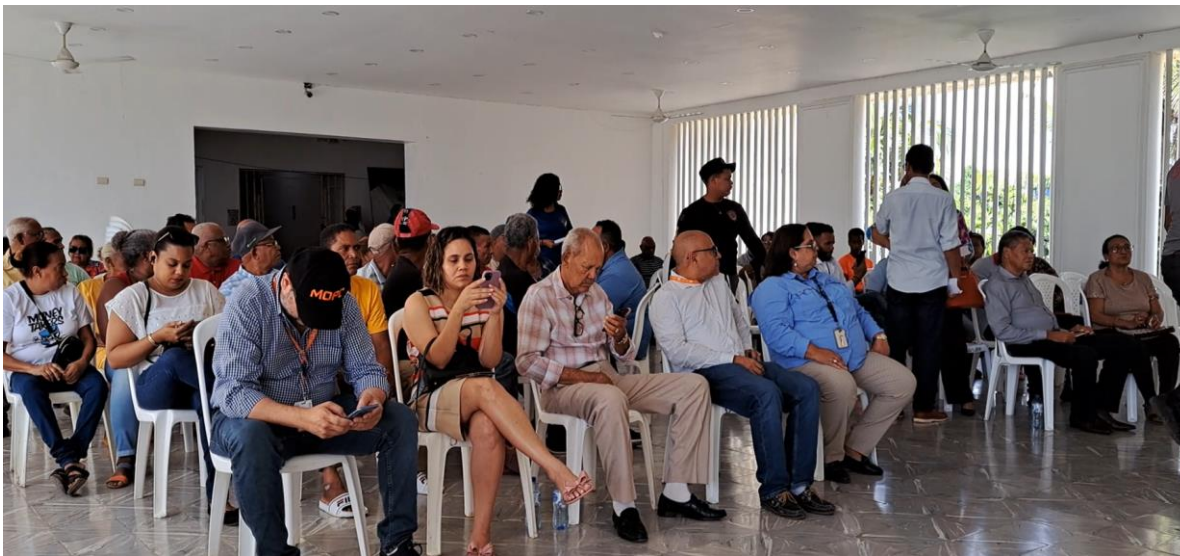
Figura 4-1. Participantes Vista Publica