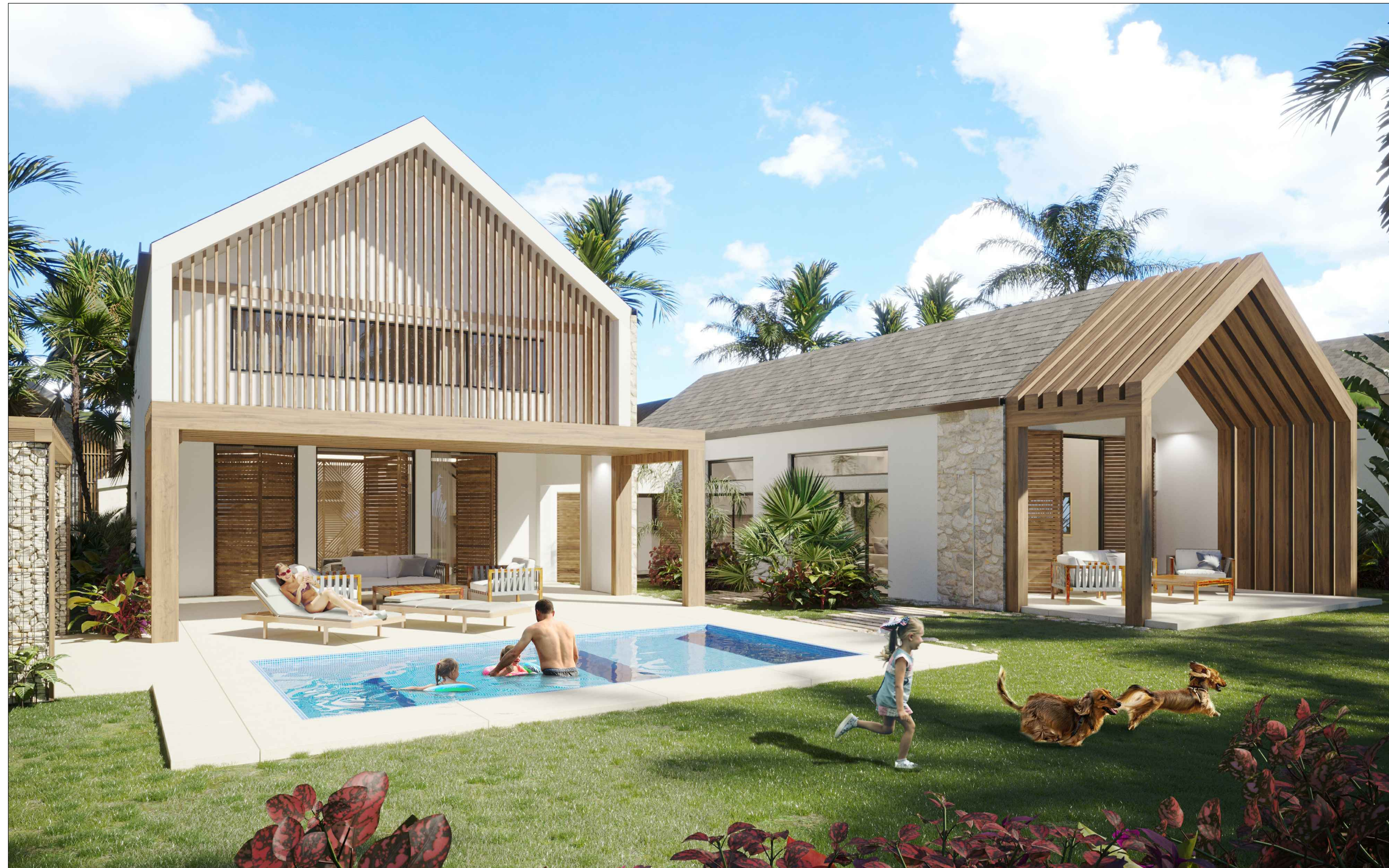
1 RENDER VISTA POSTERIOR A-109 ESC. NVA