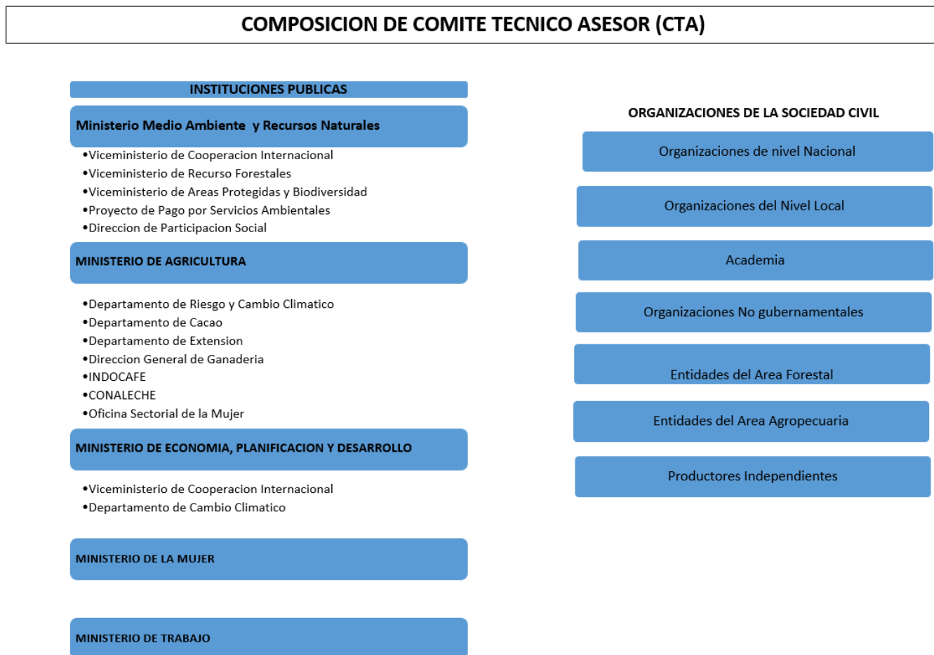
Figura 2. Composición multisectorial del Comité Técnico Asesor (CTA) del Programa REDD+.

A continuación, se presenta el contenido propuesto para el Reglamento Interno para la Operación y Funcionamiento del Comité Técnico Asesor (CTA), como instancia u órgano consultivo y de apoyo técnico con carácter interinstitucional y multisectorial en el marco del Programa de Reducción de Emisiones por Deforestación y Degradación de los Bosques de la República Dominicana (Programa REDD+), el cual aborda los aspectos relacionados con su conformación, sus atribuciones, competencias específicas, representación, períodos de convocatorias y los mecanismos de aprobación para la toma de decisiones.