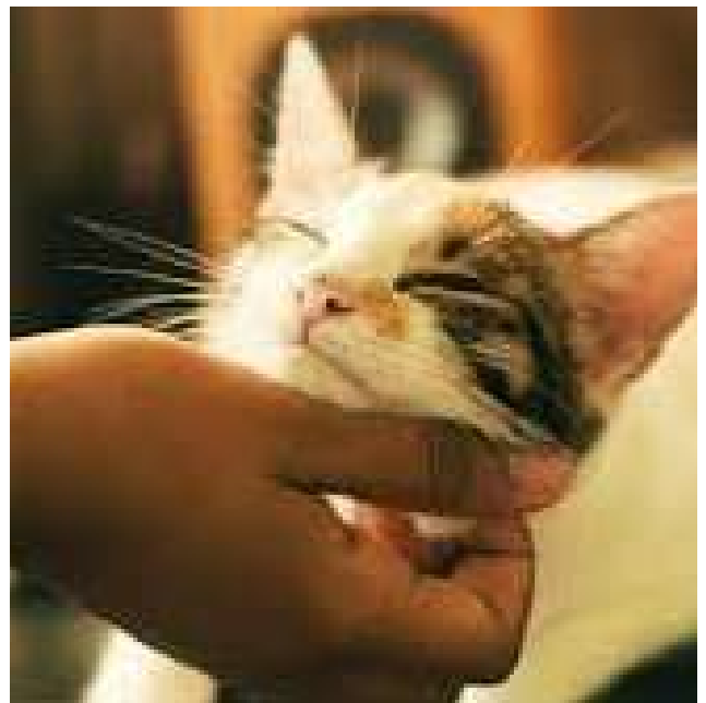
Why We Think Getting A Kitten Is The Best Gift In The World, Posted on November 19, 2020 by Rosie Benne