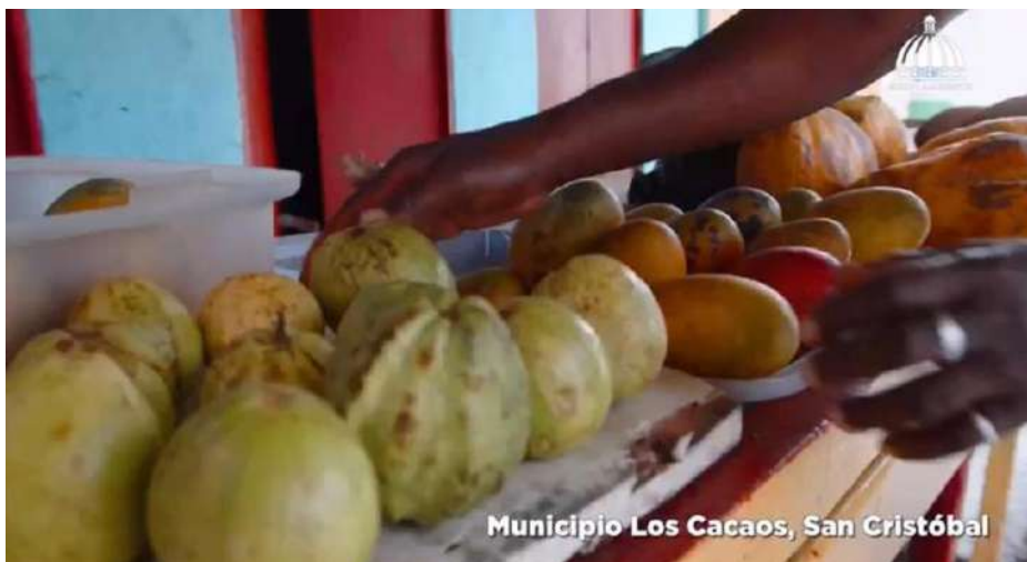
Municipio Los Cacaos, San Cristóbal