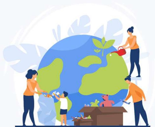
LABOR SOCIAL ESTUDIANTIL

Desde la Dirección de Educación y Divulgación Ambiental del Ministerio de Medio Ambiente y Recursos Naturales se apoya el Programa de Labor Social Estudiantil realizando charlas virtuales y presenciales para los docentes coordinadores del programa de labor social.